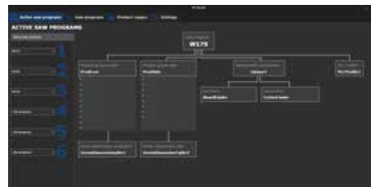
Översiktsbild för sågprogram som visar samtliga kopplade delar

Inmatningen av produkter och regler sker via ett användarvänligt gränssnitt som bygger på relationer mellan olika produkter och regler för att undvika att information måste matas in flera gånger på olika ställen. Programmet har berikats med många visuella hjälpmedel för att kommunicera på ett tydligt sätt vad de olika parametrarna har för sluteffekt.