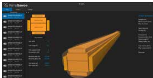
Detaljdata i realtid för de senast optimerade stockarna

Alla produktionsdata lagras i en Microsoft SQL Server databas. Produktionsrapporter kan skapas för till exempel en viss tids- period, timmerklass eller träslag. Data kan exporteras till administrativa system.