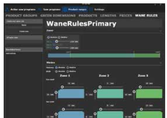
Exempel på visuellt hjälpmedel för att sätta vankantsregler